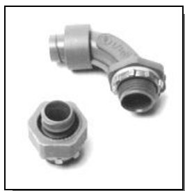
Modèle avec contre-écrou

Sealtite - NMEF (noir) est un tuyau super flexible, non métallique, étanche aux liquides conçus pour l'emploi des applications de grade OEM comme les composants de robots, ou l'installation électrique de machine-outil intérieur. Disponible uniquement en noir, diamètre commerciale de 3/8" a 2", uniquement en rouleau standard. Approuvé CSA et reconnu UL.