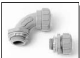
Raccord a 3 morceaux

Le fabricant canadien en tête des conduits flexibles